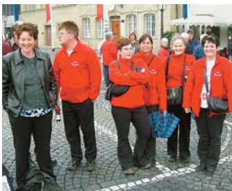
Einige Fans der Balmer, die in Zofingen dabei waren.

Am Wochenende vom 12. bis 14. September 2008 fand in Zofingen erstmals ein Eidgenössisches Musikfest für Musikanten bis 20 Jahre statt. Der Tambouren- und Pfeiferverein von Saas-Balen nahm daran mit sechs Einzelwettspielern und zwei Gruppen teil.