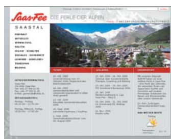
Grosser Erfolg für die Gemeinde Saas-Fee, die mit ihrer im November 2007 erneuerten Website den 1. Platz belegt.

Eine Fachgruppe untersuchte auch in diesem Sommer alle rund 2000 Websites von Schweizer Gemeinden anhand eines Katalogs mit über 60 Kriterien. Bewertet wurden neben dem Informations-, Interaktions- und Transaktionsangebot auch die Benutzerfreundlichkeit und die Barrierefreiheit. Das Design, die Sicher-