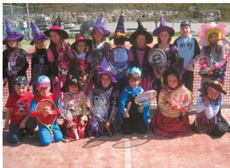
Die Jüngsten des Tennisclubs Saas-Grund.

Am 24. September 2008 fand der traditionelle Abschlussnachmittag für die Junioren des Tennisclubs Saas-Grund statt.