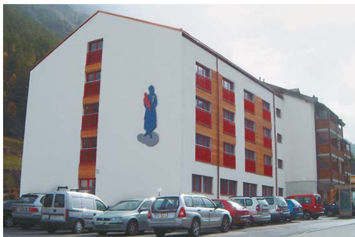
Der Neubau fügt sich harmonisch an das bestehende Gebäude an.

Der von der Architekturgemeinschaft Balzani/Zurbriggen konzipierte Neubau gliedert sich adäquat an das bestehende Gebäude an. Auch im Innern ist der Übergang vom Alt- zum Neubau geradezu nahtlos. Hell und freundlich präsentieren sich die neuen Zimmer. Höher ausgefallen als geplant sind die anfänglich auf 5,5 Millionen Franken budgetierten Kosten, da der ursprüngliche Kostenvoranschlag den tatsächlichen Kosten in keiner Art und Weise standhielt. Als Folge mussten Planungsänderungen vorgenommen werden. So wurde der Umbau des