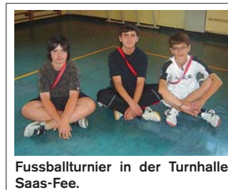
Fussballturnier in der Turnhalle Saas-Fee.