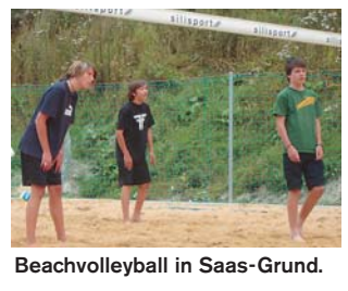
Beachvolleyball in Saas-Grund.