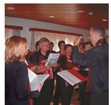
Der Kirchenchor Saas-Grund umrahmte mit seinem festlichen Gesang den Einweihungsgottesdienst.

Spätsommer 2008 war das Werk vollendet – die Erweiterung schmiegt sich harmonisch und funktionell an das bestehende Gebäude an. Die Bauphase erstreckte sich über einen Zeitraum von 15 Monaten. Eine Zeitspanne, die für die Pensionäre, das Pflegefachpersonal, den Heimleiter, aber auch für die Architekten und Handwerker eine Herausforderung darstellte, galt es doch, trotz Lärm, Staub und Unannehmlichkeiten den normalen Betrieb aufrechtzuerhalten. >> Seite 3