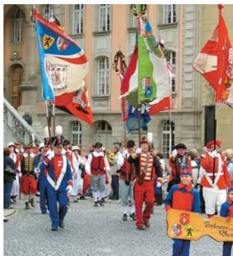
Die Grossformation des Oberwalliser Tambouren- und Pfeiferverbandes am Umzug.

Diese wurden von vielen Balmern und Heimwehbalmern begleitet, unterstützt und angefeuert. Am Freitag ging es ums Eingemachte. Den ganzen Tag über waren die Einzelwettspieler im Einsatz. Zwei Tambouren und vier Pfeifer präsentierten ihr Können vor der Jury. Am Samstag fanden die Vorträge der Gruppen und Sektionen statt. Von den Jungen wurden unterhaltsame Kompositionen und Märsche dargeboten. Leider spielte das Wetter nicht mit – es regnete den ganzen Tag. Doch dadurch liess man sich die Festlaune nicht verderben.