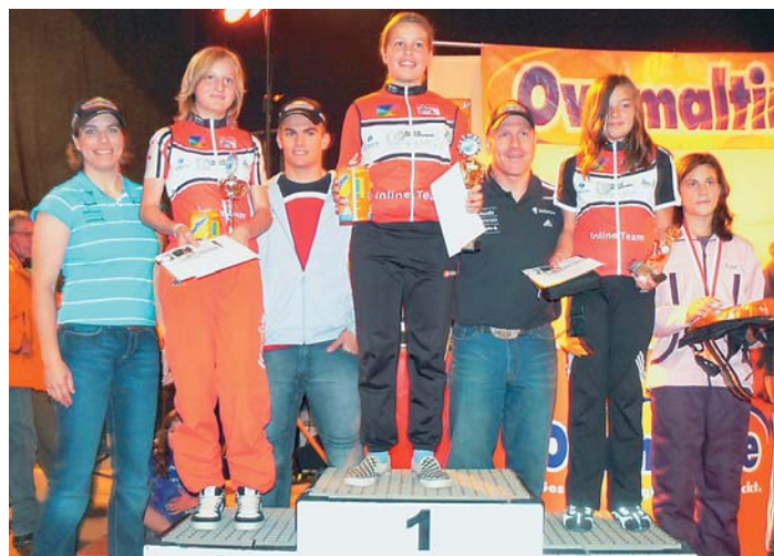
Preisverleihung mit Schweizer Skistars.