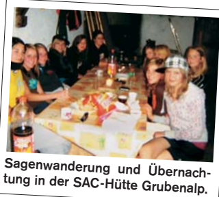
Sagenwanderung und Übernachtung in der SAC-Hütte Grubenalp.