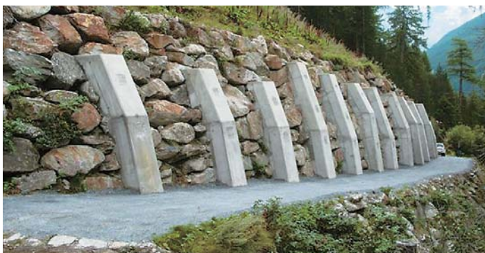
Mit der Sanierung der Rollierung Spärwurzu wurde ein seit 30 Jahren bestehendes Sicherheitsrisiko definitiv gelöst.

Auf Vorschlag des Geotechnikbüros Stefan Berchtold wurde alle 4 Meter ein 1 Meter breiter und 8 Meter hoher Pfeiler direkt an die Rollierung betoniert und mit je drei Ankern 12 Meter tief im Boden verankert. Durch die Vorspannung der Anker drücken die Betonriegel die Rollierung jetzt gegen den Hang und übernehmen damit praktisch den ganzen Hangdruck. Die Blöcke zwischen den Betonpfeilern werden nur noch minim belastet und sind ebenfalls nicht mehr absturzgefährdet.