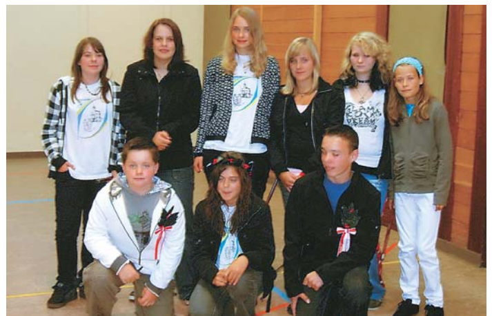
Die erfolgreichen Einzel- und Gruppenwettspieler von Saas-Balen.

Am Abend fand im Festzelt ein Unterhaltungsabend statt, der es in sich hatte. Von Guggenmusik, schottischen Klängen über Showeinlagen waren alle Musiksparten vertreten und die Zeit verging im Flug. Zu den Höhepunkten des Abends zählte sicher die Rangverkündigung der Einzelwettspieler. Die beiden Balmer Tambouren Ste-