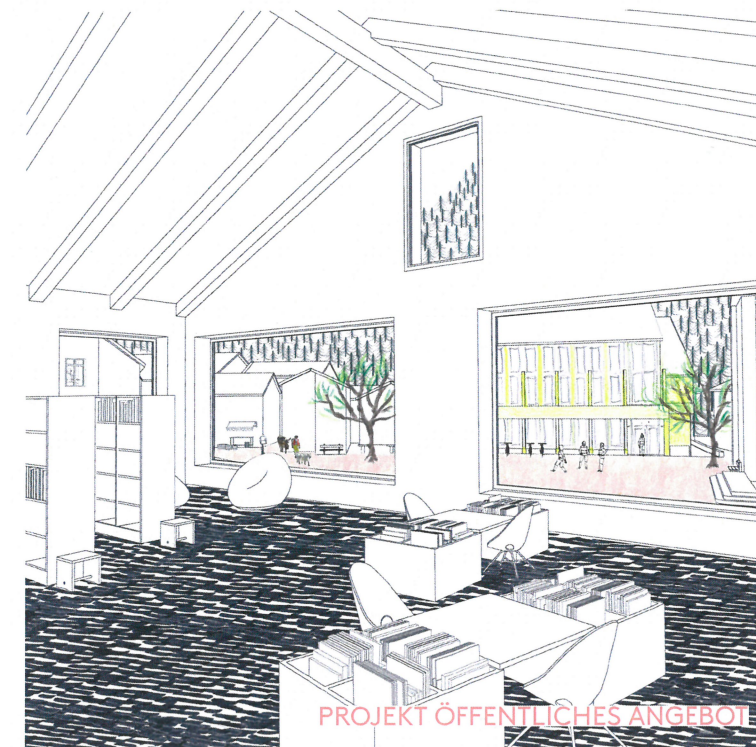
PROJEKT ÖFFENTLICHES ANGEBOT